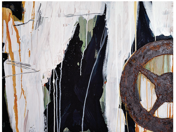
„Drive“, Mischtechnik auf Leinwand, 2014, Herbert Schmidt

Die Ausstellung ist vom 18.06. bis 27.07.2018 in der Glashalle und im OG1 des Landratsamts Tübingen, werktags von 8 bis 18 Uhr, zu sehen.